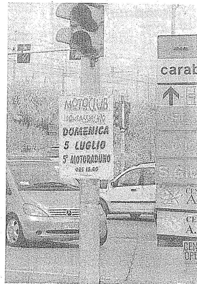
Un semaforo sull'Aurelia a Vecchiano (foto d'archivio)

rebbe si un sistema di funzionamento del semaforo non di quelli programmati e quindi fissi, ma che funzionerebbe a sensore, in un certo senso in base alla differenza di flusso di traffico fra strade principali e secondarie. «Non è qui il caso di ricordare - sottolinea il giudice Scognamiglio - le polemiche, le discussioni e le perples-