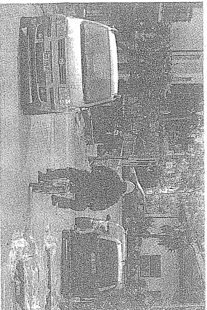
Una strada del centro di Vecchiano dove si circola regolarmente