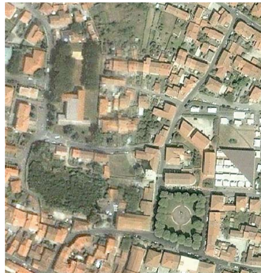
Una veduta aerea di Vecchiano

Una fetta cospicua delle risorse viene impiegata per i lavori pubblici. Tali esborsi sono eseguiti sul titolo II del bilancio comunale, riguardante gli investimenti. Negli ultimi tempi, in particolare, l'Amministrazione comunale di Vecchiano ha lavorato seguendo alcuni obiettivi specifici. Il primo degli scopi del Comune di Vecchiano è quello di rendere sempre più fruibili le piazze: è l'obiettivo primario che sta dietro i progetti di riqualificazione delle piazze sul territorio comunale. Alcuni interventi, come quelli a Nodica, sono già conclusi, mentre altri spazi sono in via di sistemazione nelle frazioni di Avane e Migliarino. A questo si aggiunge l'intenzione di migliorare la viabilità cittadina attraverso dei lavori di riasfaltatura di alcune strade comunali di Filettole, Avane e Migliarino.